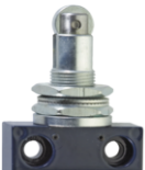
Poussoir à galet à fixation frontale FR