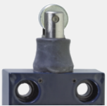
Poussoir à galet avec manchette d'étanchéité WR