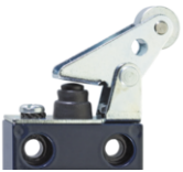
Levier parallèle avec manchette d'étanchéité WPH