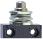
Poussoir à fixation frontale F