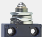
Poussoir à bille à fixation frontale FKU