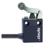
Sortie de câble latérale S