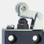
Levier à galet avec manchette d'étanchéité WH