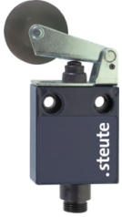
Connecteur M12 x 1, 4-poles