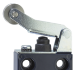
Levier à galet long avec manchette d'étanchéité WHL