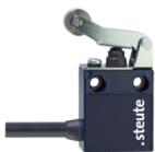
Sortie de câble latérale S