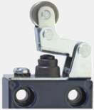
Levier basculant avec manchette d'étanchéité WHK